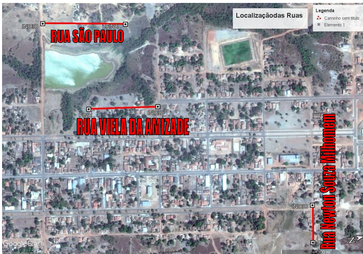
Imagem 001 – Planta de Localização das Vias.