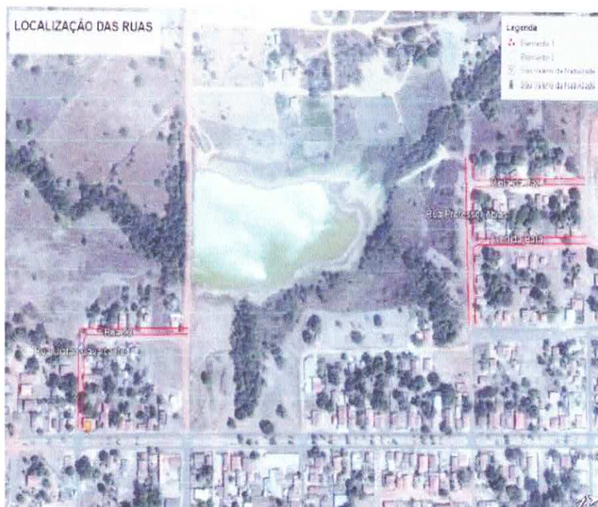
Imagem 001 – Planta de Localização das Vias.

A quantidade de recurso que estava disponível no momento das Criação do Projeto de drenagem, Canalização e Pavimentação Asfáltica da Rua Jose Lopes Chave na região da Represa do Município não disponibiliza mais recursos para o trajeto finalizar de encontro com a Avenida progresso. Administração Pública, uma vez que os serviços prestados pelo CONTRATADO são de qualidade e têm atendido a contento as necessidades da CONTRATANTE, onde durante a vigência do contrato os serviços foram prestados satisfatoriamente, sem contar que os preços serão mantidos durante a vigência. O presente termo aditivo é celebrado com base nos termos do Art. 57, Inciso I, da Lei nº 8.666/93 a