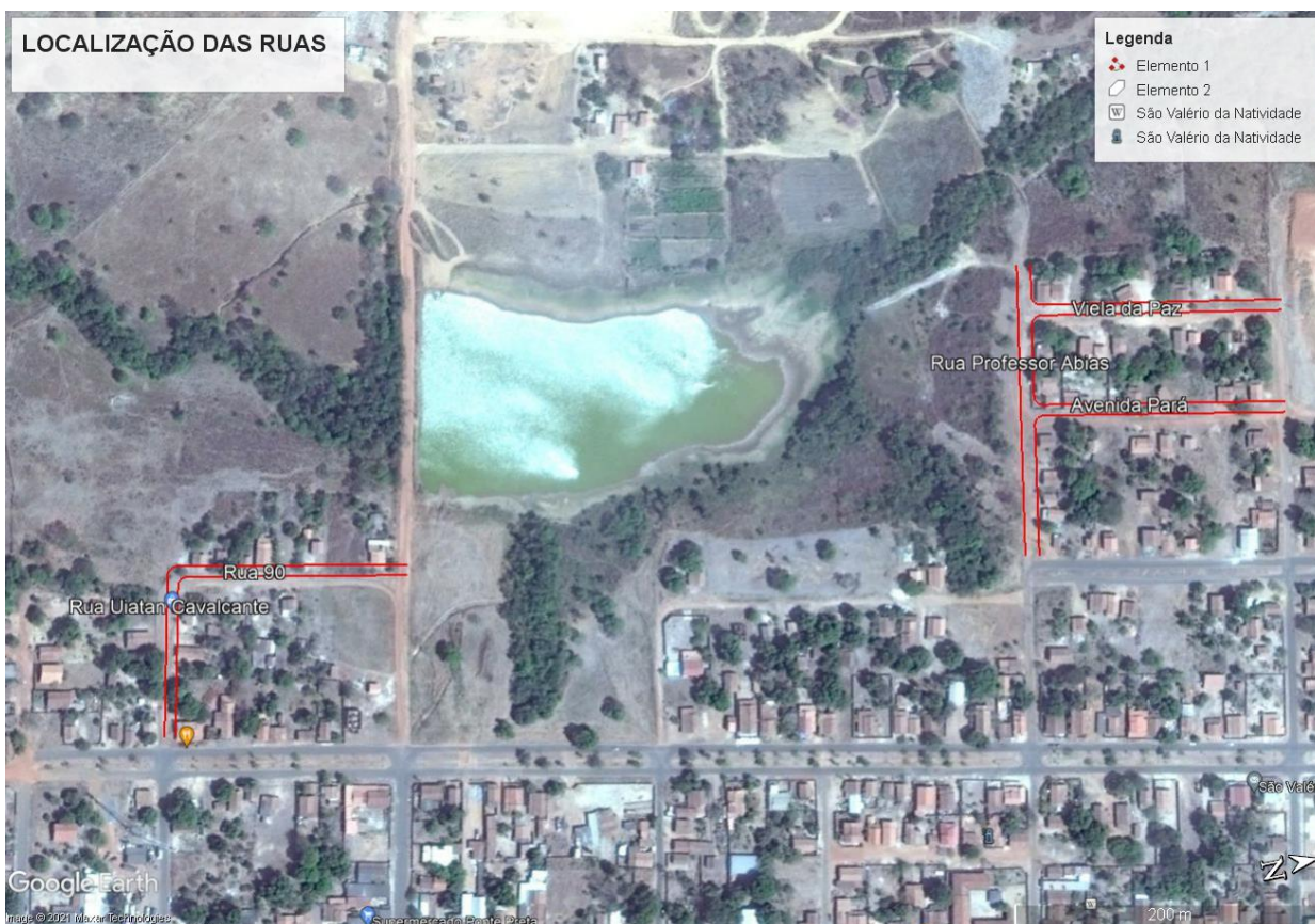
Imagem 001 – Planta de Localização das Vias.